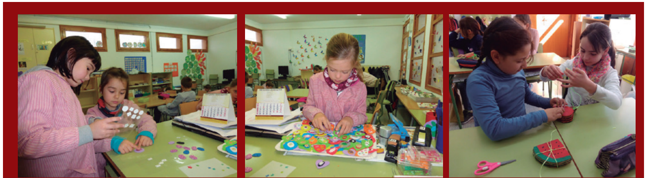
Imagen 1. Momentos de concentración y trabajo en los talleres

parten del siguiente modo: el 10% se da a la escuela para que revierta en el alumnado; otro 10% se destina a una entidad solidaria, y otro 10% se queda de remanente en el centro para comprar materiales COPROES el curso siguiente. El resto, 70%, se utiliza para pagar parte de los gastos de una salida de todo el alumnado a una cooperativa escolar de Vinaixa (Lleida) para intercambiar experiencias, y para la fiesta conjunta, alumnado URV y escuela, que sirve de broche final del proyecto.